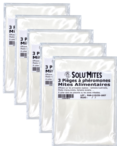
5 sachets de 3 pièges