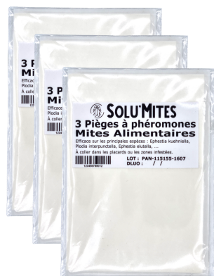
3 sachets de 3 pièges