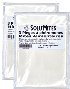
2 sachets de 3 pièges